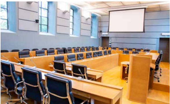
Parlement de Wallonie, 2018