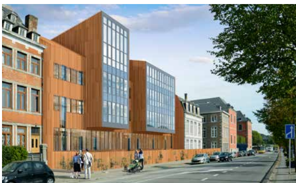
© Atelier de l'Arbre d'Or - Bureau d'Architecture Greisch