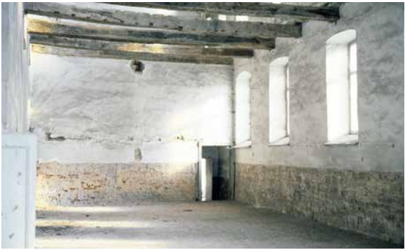
T. Cortembos (© SPW-DPat), 1989