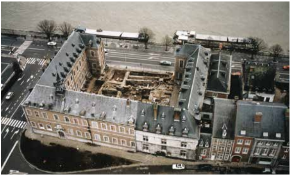
MET (© SPW), 1990