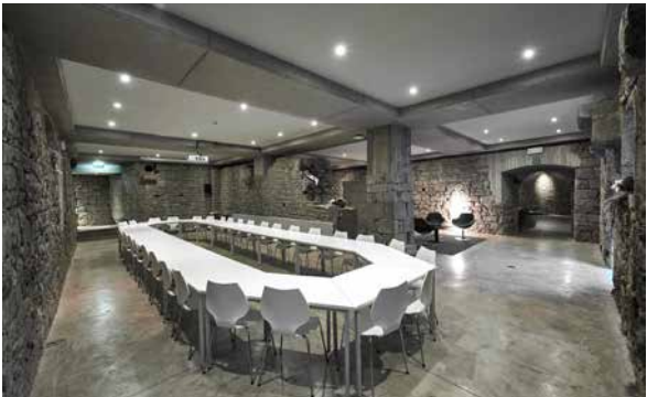
Parlement de Wallonie, 2018