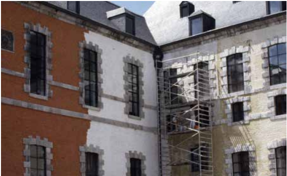
T. Cortembos (© SPW-DPat), 1997