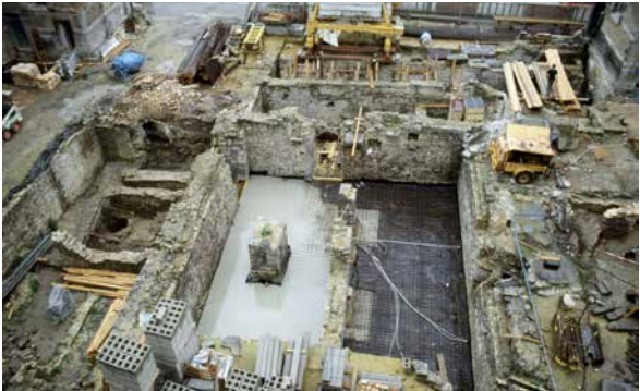
J. Plumier (© SPW-DPat), 1990