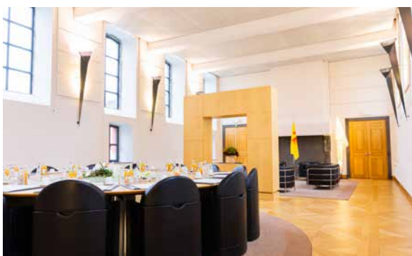
Parlement de Wallonie, 2018