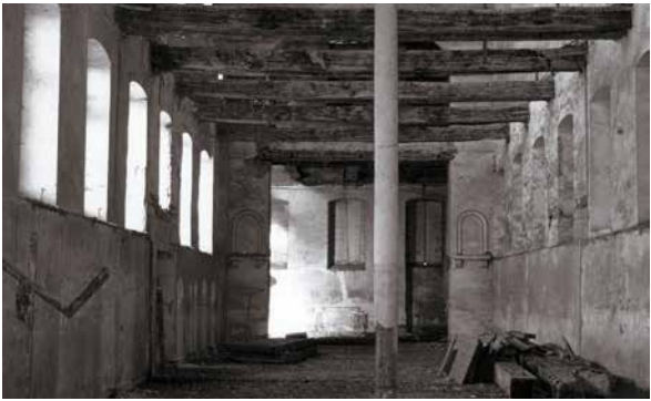
T. Cortembos (© SPW-DPat), 1989