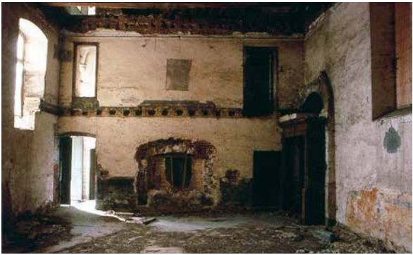
T. Cortembos (© SPW-DPat), 1989