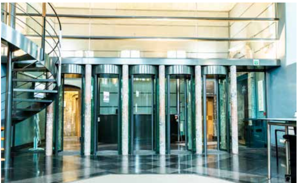
Parlement de Wallonie, 2018