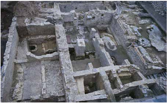
J. Plumier (© SPW-DPat), 1990