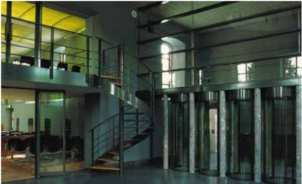
E. Bourgois, 1998