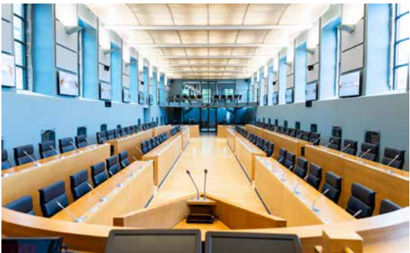
Parlement de Wallonie, 2018