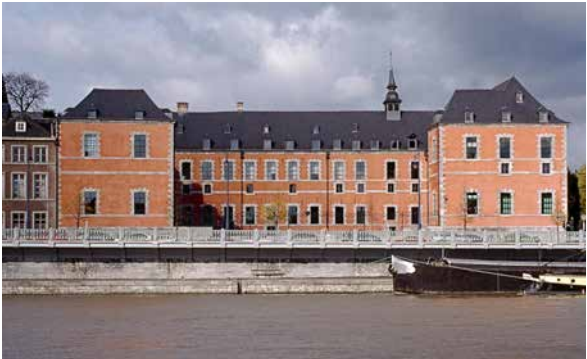
J.-L. Javaux (© SPW-DPat), 1998