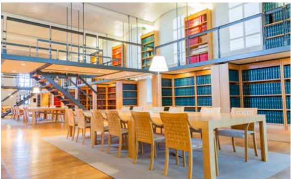
Parlement de Wallonie, 2018