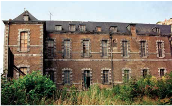
T. Cortembos (© SPW-DPat), 1989