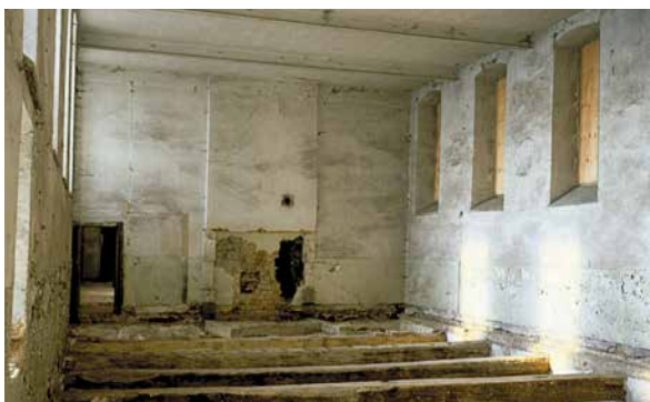
T. Cortembos (© SPW-DPat), 1989