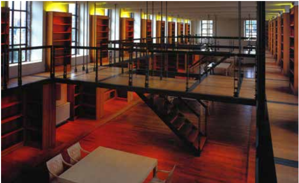
E. Bourgois, 1998