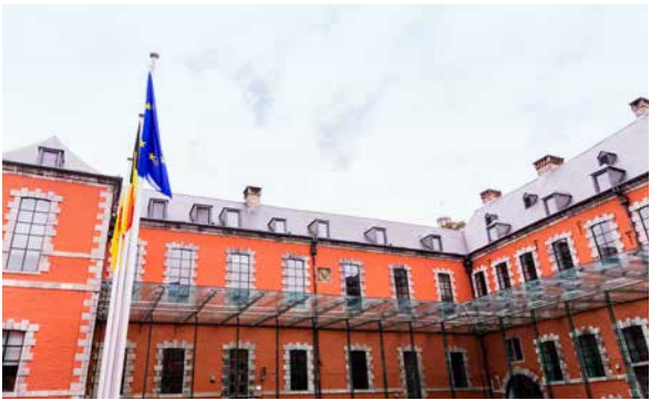
Parlement de Wallonie, 2018