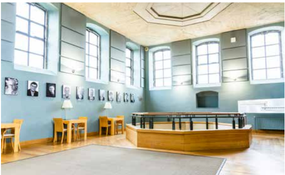
Parlement de Wallonie, 2018