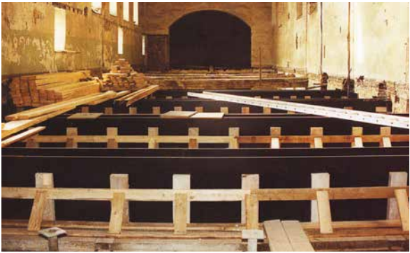
T. Cortembos (© SPW-DPat), 1989