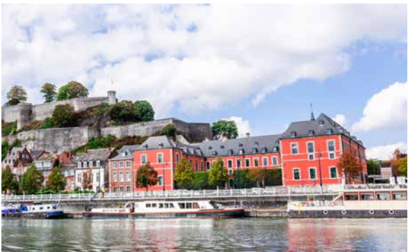
Parlement de Wallonie, 2018