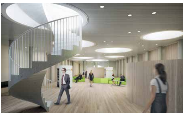
© Atelier de l'Arbre d'Or - Bureau d'Architecture Greisch