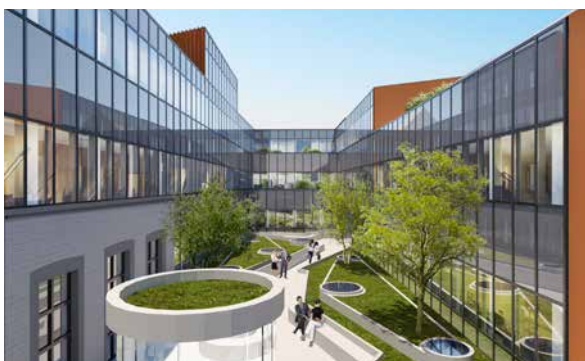
© Atelier de l'Arbre d'Or - Bureau d'Architecture Greisch